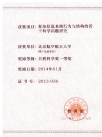
教育部自然科学奖一等奖