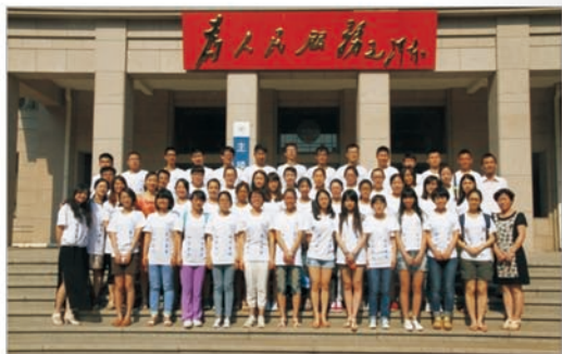
北航第三届数学夏令营合影

基于学院研究生的良好教育，学院研究生就业情况良好，毕业研究生整体就业率达到100%：除在校内硕转博外，硕士毕业生的去向包括在国内外知名高校或科研机构继续攻读博士学位（如法国巴黎六大、德国斯图加特大学、美国伊利诺伊大学等），以及选择赴百度、宝洁、普华永道、航天二院、工信部电信研究院等企事业单位直接就业等；博士毕业生去向包括于北京航空航天大学、人民大学等高校或科研机构从事教学或科研工作、赴国际知名科研机构就读博士后（如美国伊利诺伊大学、德国马普研究所、新加坡南洋理工大学等）以及直接就业等。