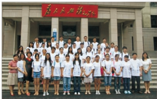
北航第二届数学夏令营合影

学院还定期举办数学暑期学校、数学夏令营等活动，为学院乃至全国的优秀本科生和研究生提供了学习与交流的优秀平台。