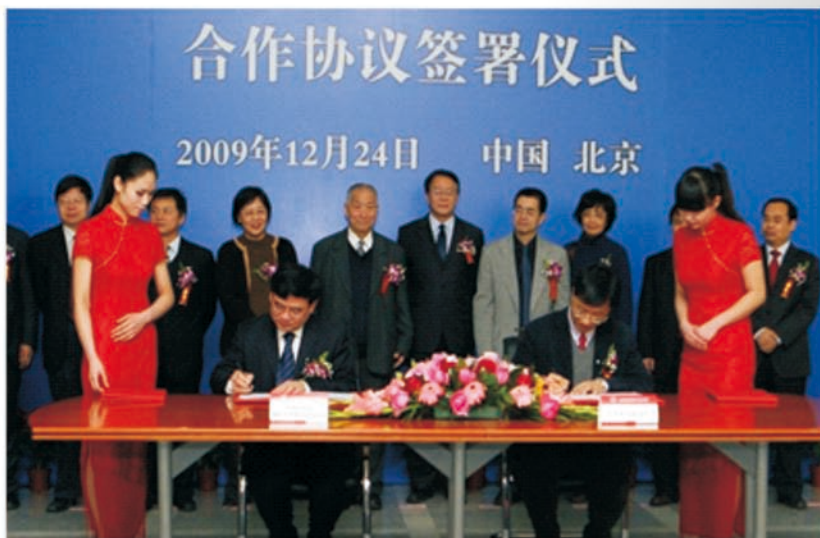
华罗庚班合作协议签署仪式

2009年，北航与中科院数学与系统科学研究院签署协议联合成立“华罗庚班”，实施“一生一师”的个性化培养，这是学校加快精英人才培养步伐所采取的又一重要举措。特别地，华罗庚班的2010级全体学生于2013年暑期在美国密西根州立大学学习六周。另外，从2014年起，学院开始实施与美国德克萨斯A&M大学合作的“北航—德克萨斯A&M大学数学快车道项目”，每年选派7—10名优秀学生前往德克萨斯A&M大学学习交流1年。