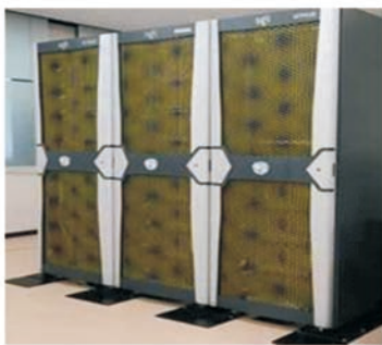
“曙光”TC4000高性能计算机机群

学院下设数学系、应用数学系、信息与计算科学系、统计、运筹与控制及数学研究所、数学实验中心，建有“数学、信息与行为”教育部重点实验室、教育部“数字化教育装备研究中心”、北航“复杂系统与科学工程计算国际研究中心”。另外，学院购置了“曙光”TC4000高性能计算机机群和1024CPU SGI超级计算机等设备，订购了国外著名原刊44种，拥有图书1.2万册，已具备国内一流的学习、科研条件，为开展原创性研究和高水平研究生培养提供了有力的支撑。