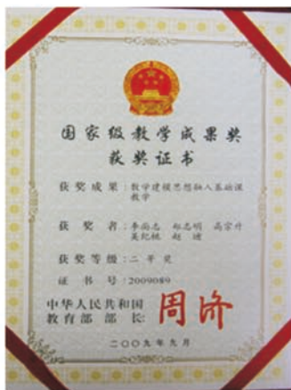
国家级教学成果奖二等奖